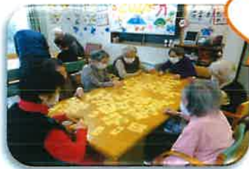
壁絵作りやカードゲームなど♪