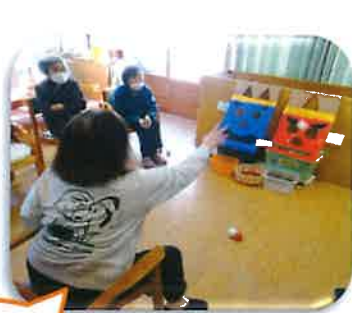
節分豆まきゲーム！