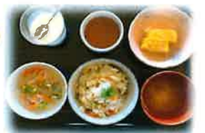
混ぜご飯・だし巻き卵 春雨の酢の物・味噌汁 ミルクゼリー♡ 手作りのスイートポテトも♪