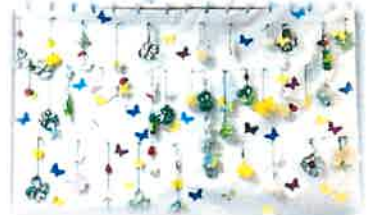
クローバーや蝶の吊るし飾り

暖かい日も増え、春の訪れを感じます！ 寒暖差や花粉症などに気を付けて過ごしましょう！